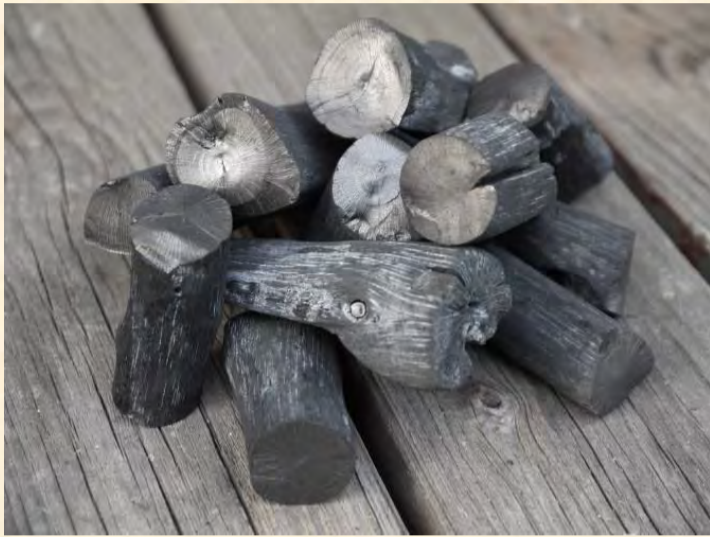
Carbón vegetal en polvo negro