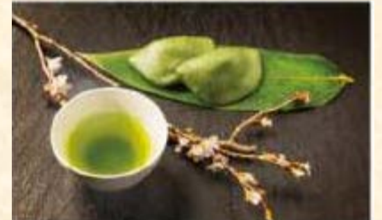
Té con Artemisia