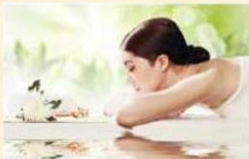
Spa con Artemisia