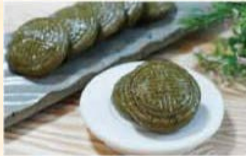
Comida con Artemisia