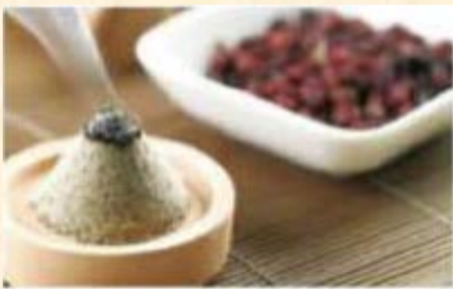
Terapia con Artemisia