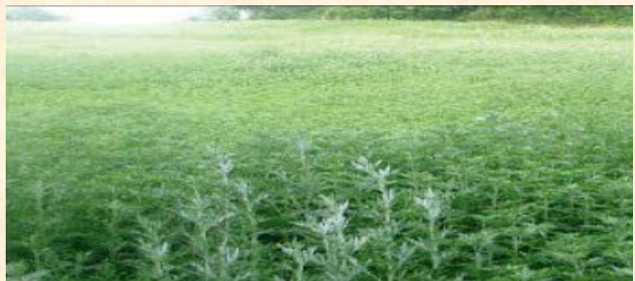
Plantación de Artemisia princeps en la isla de Chorack