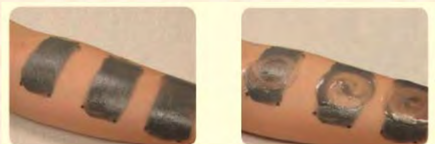
Perlas naturales Perlas plásticas XFoil PEARL Perlas naturales Perlas plásticas XFoil PEARL

XFoliPEARL™ limpia la piel suavemente y más eficientemente que las perlas naturales probadas.