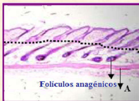
A) Fase anagénica en el crecimiento capilar El bulbo piloso está rígido y presente en la hipodermis profunda.

La línea punteada indica la unión epidermis-dermis